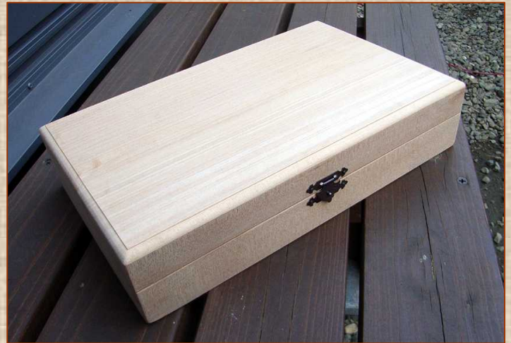
これが原形のトリマービット箱